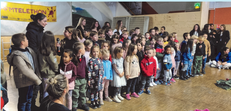
Les écoliers du Primaire