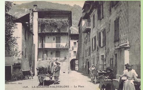
Place de la Casetta (ou Casetto)