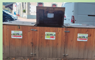
Les 3 bacs