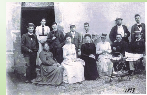
Une famille bourgeoise de La Bolline

« Tout l'avenir est dans l'incertitude : vivez dans l'immédiat » - Sénèque