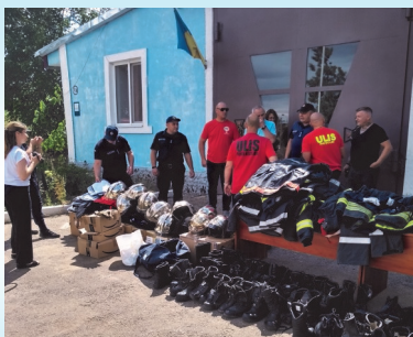
Équipements ramenés aux Pompiers.