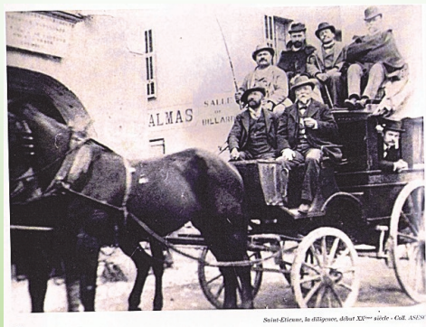
L'ancienne Diligence du début du 20e siècle a été remplacée ensuite par...