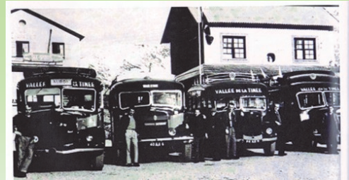
...les Cars de la Tinée à Isola

Nota : Certaines photos sont à rapprocher du journal n°51