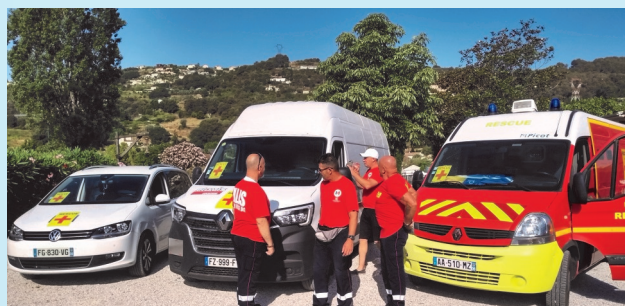
Ambulance neuve livrée par la France, et l'ancien.