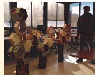
← Montage Alvéoles.