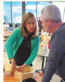
Bravo aux équipes enseignantes, aux intervenants et bien sûr à tous les élèves. J. Dugeay.

Le Lycée de la Montagne a toujours su monter des projets, fédérer des classes, ouvrir l'établissement à des intervenants extérieurs, artistes ou professionnels de tous bords.